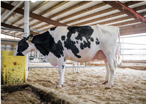
AOT DELUXE HI-LIGHTED DAM